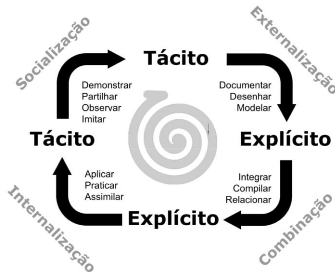
Figura 3 - Modelo SECI de conversão do conhecimento.

Para entender melhor as dimensões do conhecimento SECI no contexto deste estudo, é importante entender como Nonaka et al. (2000) definem conhecimento. Segundo tais autores, conhecimento é uma crença verdadeira justificada, sendo dinâmico e dependente de contexto de aplicação, podendo ser encontrado em duas formas: tácito e explícito. O conhecimento tácito é aquele sob domínio de um indivíduo, adquirido ao longo da vida, sendo de difícil transmissão para terceiros. Já o conhecimento explícito é aquele que é formalizado através de documentação, desenhos, projetos, entre outras metáforas. Também afirmam os conhecimentos tácito e explícito se complementam e são essenciais para a criação de conhecimento. Em outras palavras, defendem que novos conhecimentos são criados pela conversão entre conhecimento tácito e explícito, que fundamenta o modelo SECI, como mostrado na Figura 3.