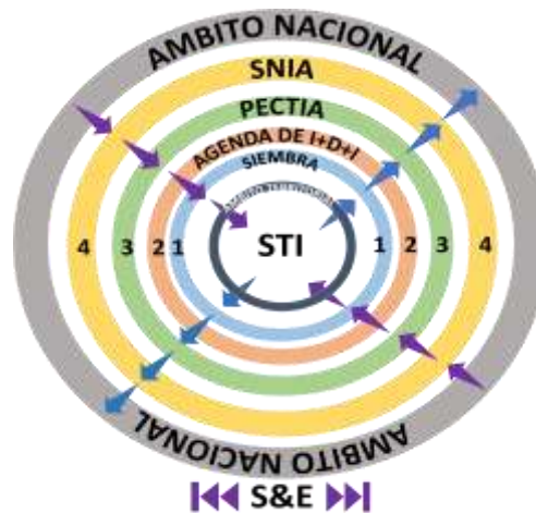
Figura 2- Esquema de integración para la gestión del SNIA.

innovación como espacio fundamental para la gestión de la CTI. En este espacio el PECTIA y la Agenda son puntos de referencia, sobre los cuales se estructuran las relaciones orgánicas (actores e instancias), como evidencia de la creación e implementación del SNIA.