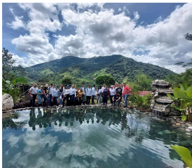
Foto 1- Finca AulaViva Tropical y Participantes

Fuente: Foto aportada por el propietario de la Finca