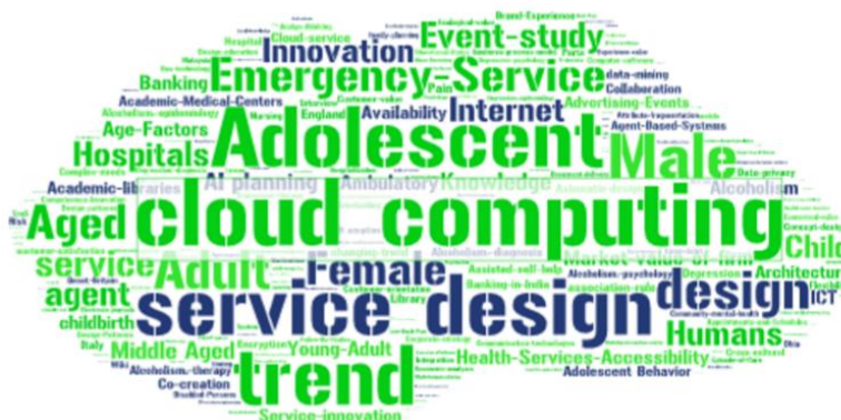
Figura 2 – Frequência de palavras

A análise das palavras-chave, do portfólio bibliográfico, indicou a ocorrência de 252 termos, sendo combinações de palavras que foram consideradas no momento das buscas as bases de dados. Depois de analisadas todas as 252 palavras-chave, a próxima etapa foi representar a frequência desses termos em uma nuvem de tags, conforme Figura 2, utilizando-se um gerador de nuvem de palavras online .