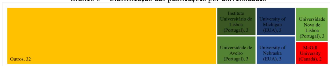
Gráfico 3 – Classificação das publicações por universidades