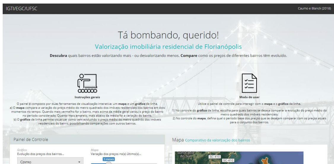
Figura 1 – Primeira parte da estrutura do sistema “Tá bombando, querido!”

O “Tá bombando, querido!” foi desenvolvido a partir da combinação de aplicativos web construídos no pacote Shiny , em linguagem R, com layout de página da internet estruturado em Bootstrap 4 - Html, CSS e Java Script . Está composto por um mapa, um gráfico, um painel de controle, instruções de uso e um link para um conteúdo de especificações metodológicas mais detalhadas, conforme demonstram as Figuras 1 e 2.