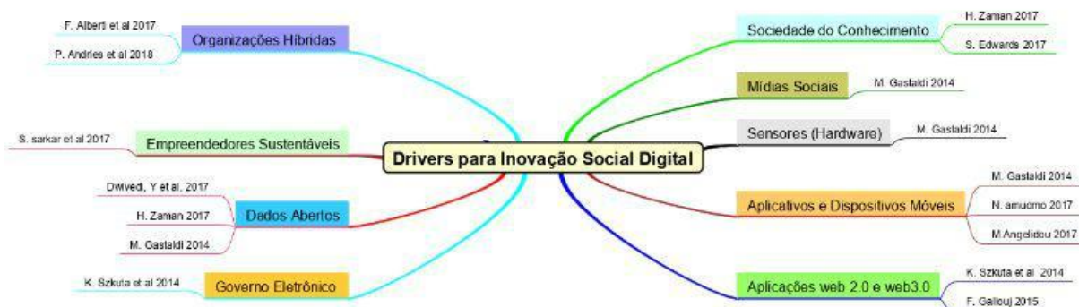
Figura 2. Mapa Mental com os Determinantes de Inovação Social Digital

Ao final da análise, de acordo com a Tabela 4, 11 EP foram considerados como artigos aceitos (AA). A síntese consistiu em identificar os determinantes encontrados nos EP aceitos na análise. Para ilustrar graficamente e ajudar na visualização, foi elaborado um Mapa Mental (Figura 2), o qual descreve os determinantes ( drivers ) encontrados e as respectivas fontes (referências). Segundo Belluzzo (2006), a representação do conhecimento sob a forma de mapa mental, com os conceitos organizados de forma relacional e modular, é uma maneira alternativa para estruturar a informação e que auxilia na comunicação dos resultados.