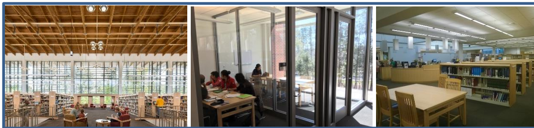
Figura 2 – Chapel Hill Library

Com o intuito de inovar em seus serviços oferecidos a biblioteca de Chapel Hill recentemente aplicou o Design Thinking para trazer mais inovação ao ambiente. O usuários foram ouvidos em uma pesquisa de algumas semanas foram realizadas para que suas principais ideias fossem listadas e assim, a equipe pode focar na resolução dessas necessidades.